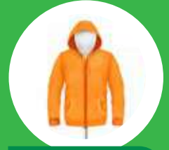
Ropa de abrigo

En Cordillera el clima es Frío, llevar ropa de invierno, zapatillas de trek o cómodas.