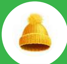
Gorro de frío