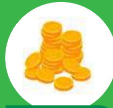
Dinero en efectivo