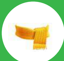
Chalina y guantes