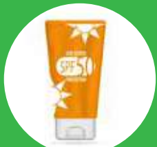
Repelente y Bloqueador